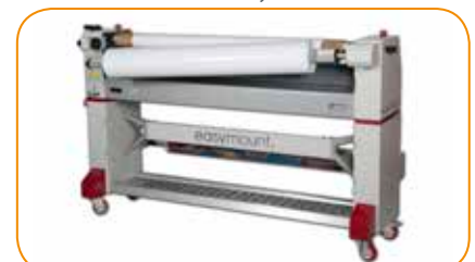
Le mandrin arrière pivote pour faciliter le chargement des plastifiés