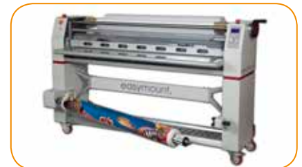
Le mandrin avant pivote pour faciliter le chargement des vinyles